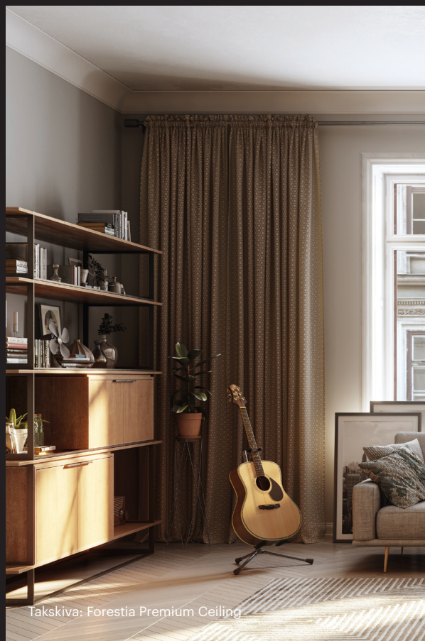
Takskiva: Forestia Premium Ceiling