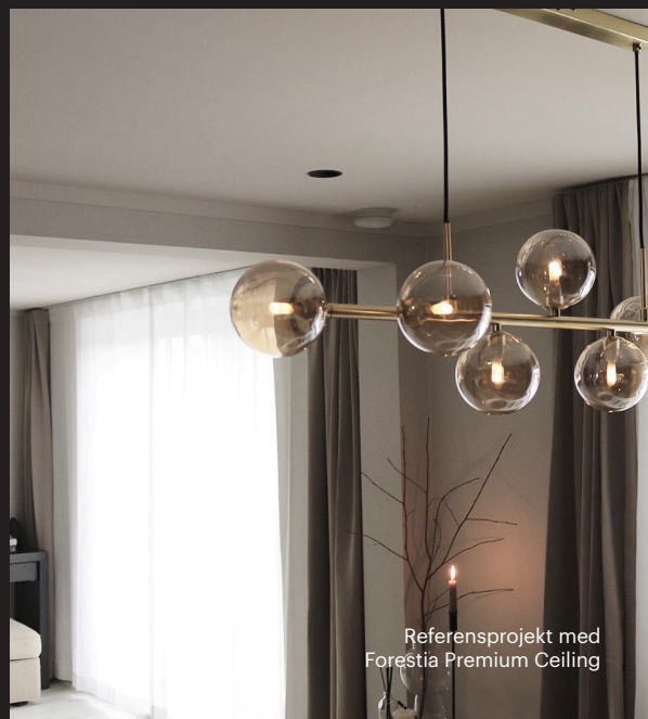
Referensprojekt med Forestia Premium Ceiling